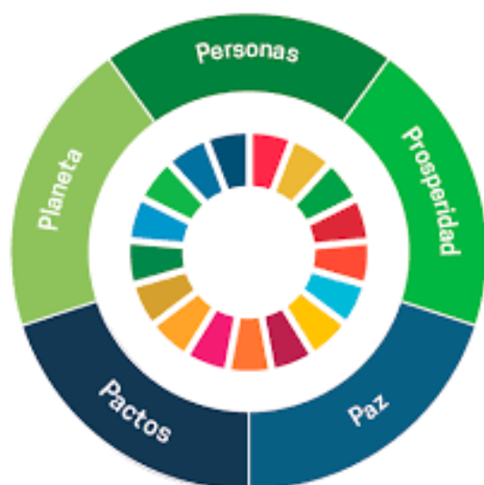
Figura 1. Esferas de desarrollo sostenible.

Los talleres comprendieron cinco mesas temáticas vinculadas directamente con las cinco esferas del PNUD, que abarcan los 17 Objetivos de Desarrollo Sostenible. Se realizaron variaciones de acuerdo con las líneas y enfoques priorizados en el programa de gobierno del alcalde.